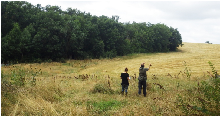
Chaque projet de plantation est défini sur site avec les propriétaires et exploitants agricoles

Onze nouveaux kilomètres de haies sont venus s'ajouter l'hiver dernier aux onze kilomètres déjà replantés par le SMIVAL depuis 2009. Chaque année le SMIVAL élabore en concertation avec les propriétaires et exploitants des projets de plantations qui répondent à une problématique d'inondation ou de ruissellement. En zone inondable ou sur des parcelles agricoles sensibles aux coulées de boue, le SMIVAL invite ainsi les propriétaires à prendre part au programme de plantation. Les exploitants agricoles peuvent également contacter directement le SMIVAL pour proposer leurs projets d'aménagement. Ceux-ci doivent répondre à des objectifs hydrologiques précis : retenir, ralentir ou favoriser l'infiltration de l'eau.