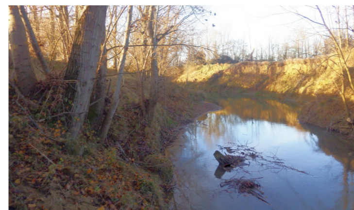
La section d'écoulement de la Lèze à Lagardelle est restaurée après les travaux d'entretien

Les travaux correspondant à la tranche 3 du programme, confiés à la SCOP Douctouyre et réalisés sous le contrôle du SMIVAL pour un montant de 35 000 € HT, ont démarré en septembre 2015. Malgré quelques jours d'interruption en raison des conditions météorologiques ainsi que de problèmes mécaniques rencontrés par l'entreprise, les travaux se sont poursuivis normalement et ont finalement été achevés le 2 février 2016, soit une durée totale des travaux de 19 semaines.