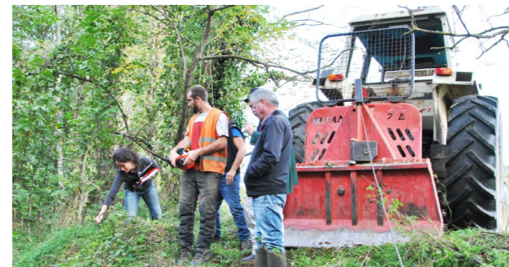
Le treuil du tracteur forestier permet de remonter les troncs d'arbres du lit de la rivière lors des travaux d'entretien de la Lèze au Fossat

Durant l'hiver 2015-2016, les travaux d'entretien régulier ont concerné la Lèze sur un linéaire total de 26 000 mètres sur les communes de Lagardelle, Beaumont, Montaut, Saint Ybars, Castagnac, Massabrac, Sainte Suzanne et Le Fossat, conformément au programme pluriannuel de gestion approuvé par arrêté préfectoral du 22 septembre 2014.