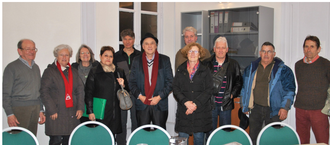
Le SMIVAL à l'écoute de l'Association des Sinistrés de la Lèze, le 9 février 2016