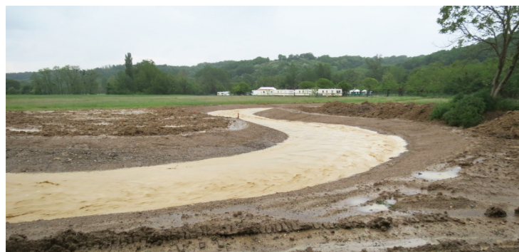
La noue s'est correctement mise en eau lors de l'orage du 12 mai 2016

Lors des orages du 25 mai et 10 juin 2007, 30 à 35 habitations ont été sinistrées à plusieurs reprises par le débordement du ruisseau du Jacquart. Suite à ces épisodes pluvieux intenses, des travaux de débusage du ruisseau ont été réalisés en 2008 dans la traversée du village, afin de favoriser l'écoulement des eaux. De plus, plusieurs érosions de berges ont été relevées au niveau du chemin communal longeant le Jacquart.