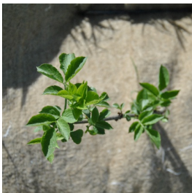
Le paillage des plants limite la concurrence et favorise la croissance

Les travaux sont ensuite réalisés pendant la période hivernale (décembre-mars) par une entreprise mandatée par le SMIVAL dans le cadre d'un marché public. Ils consistent à travailler le sol, mettre les plants en terre, installer un paillis et éventuellement des protections contre les chevreuils, et assurer la reprise pendant un an. Au cours de l'hiver 2015-2016, c'est l'entreprise BOTANICA qui a réalisé la plantation de près de 20 000 arbres et arbustes , pour un montant de travaux de l'ordre de 110 000 € HT.