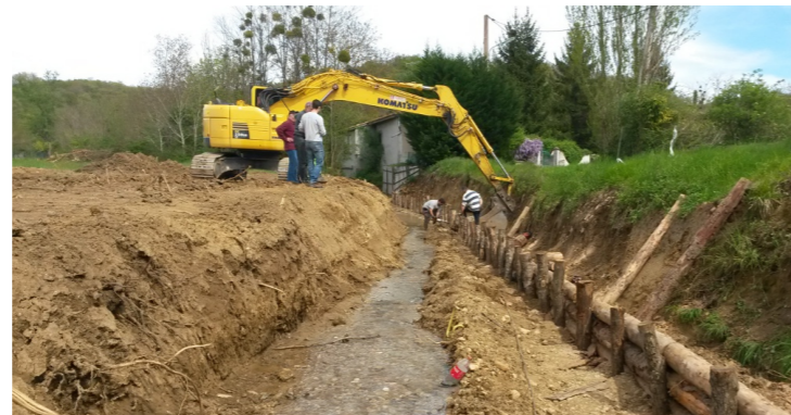
Six semaines de travaux ont été nécessaires pour achever la création de la noue et le confortement des berges

Les berges fortement érodées ont également fait l'objet de travaux de confortement sous la forme de pieux en bois, technique végétale appelée tunage. Ces travaux s'accompagneront cet hiver de plantations de saules destinées à reconstituer une végétation adaptée sur les berges du ruisseau.