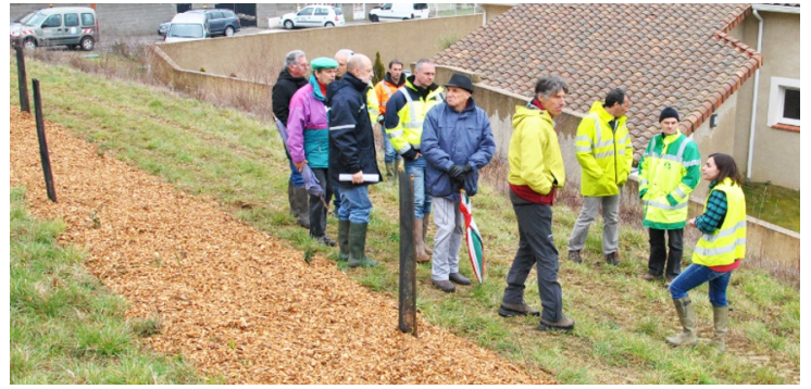
Élus, partenaires techniques et financiers ont constaté l'avancée des travaux avec les propriétaires et exploitants planteurs à l'occasion d'une visite de chantier le 16 mars 2016