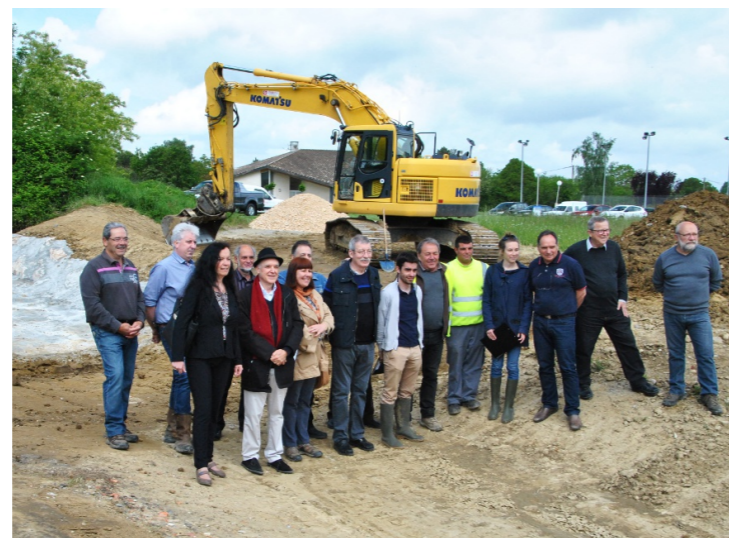
Après les phases de concertation, de conception, de procédures réglementaires et de travaux, les élus se sont réjouis de la fin du chantier de la noue du Jacquart lors de la visite du 19 mai 2016